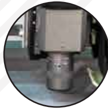
YÜKSEK HIZDA KESİM